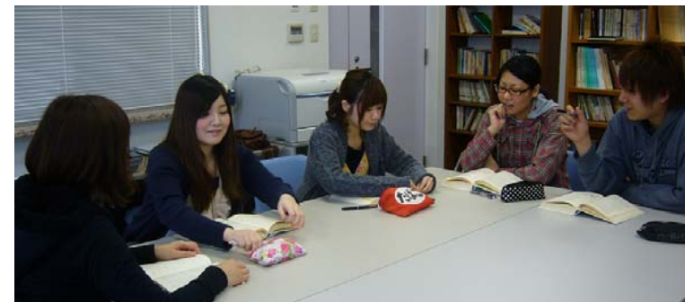
《大学院精神保健学専攻心理学領域》の学生さんたちでした。学部からのお付き合いとのことでわきあいあいとした雰囲気の中、撮影を行いました。